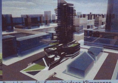
Passivhäuser für 5 verschiedene Klimazonen (Dubai, Las Vegas, Jekaterinburg; Shanghai, Tokio), hier: Shanghai

Zusammen mit unserem kooperierenden Ingenieurbüro